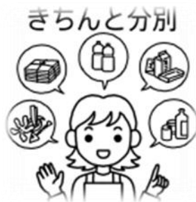
ゴミの分別とゴミ出し