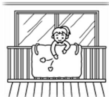
布団干し・取り込み