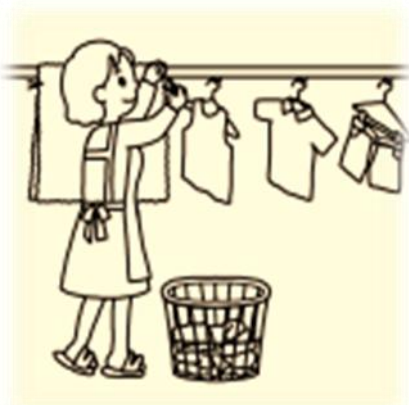
洗濯物干し・取り込み・たたみ