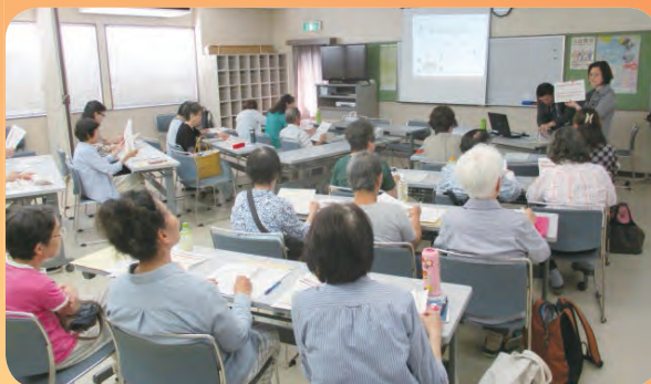
家事援助サービスによる食中毒予防研修