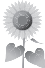
〔監事〕 福島 勇一 〔平成21年4月1日就任〕 清泉中学校地区