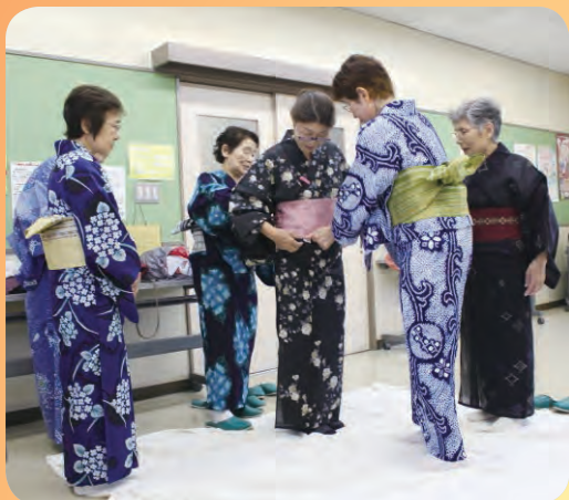
家事援助サービス 着物の着付け講習