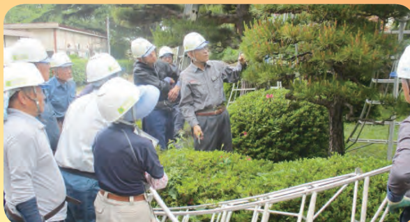
奥山会員指導による松の手入れ研修会