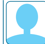
〔役職〕 氏 名 〔就任年数〕 中学校地区名