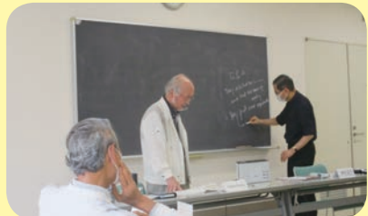
熱のこもった英会話教室 (イキイキ・ニコニコ介護予防教室)