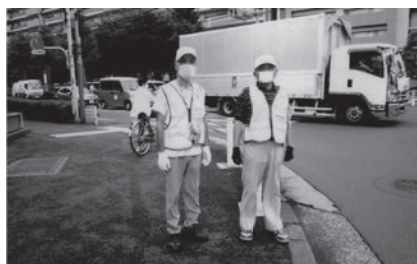
佐野会員(写真右側)

チームパトロールでは下校時の声掛けに、元気であいさつを返す子、何か思案顔の子と様々ですが、「将来、社会貢献のできる人になって欲しいな」と願いながら、パトロール活動をしています。