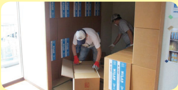
シャトル(バトミントン)の羽根入荷作業