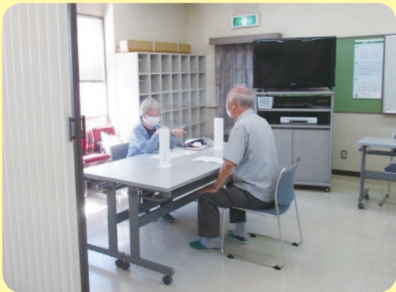
放課後子ども教室選考会の様子