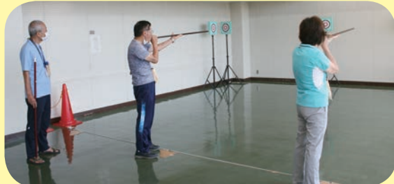
満点の35点を目指して！スポーツ吹き矢教室 (イキイキ・ニコニコ介護予防教室)