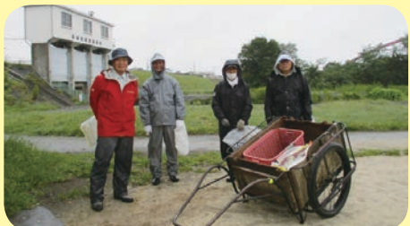
雨天の中でも真摯に取り組む、 大神・くじら運動公園の清掃作業