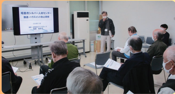
接遇研修（民間企業等対象）①