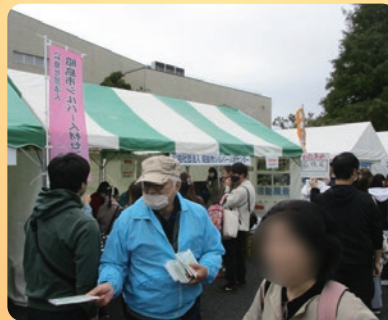
産業まつりでのシルバー PR マスク配布