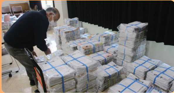
広報配布配送・仕分け作業