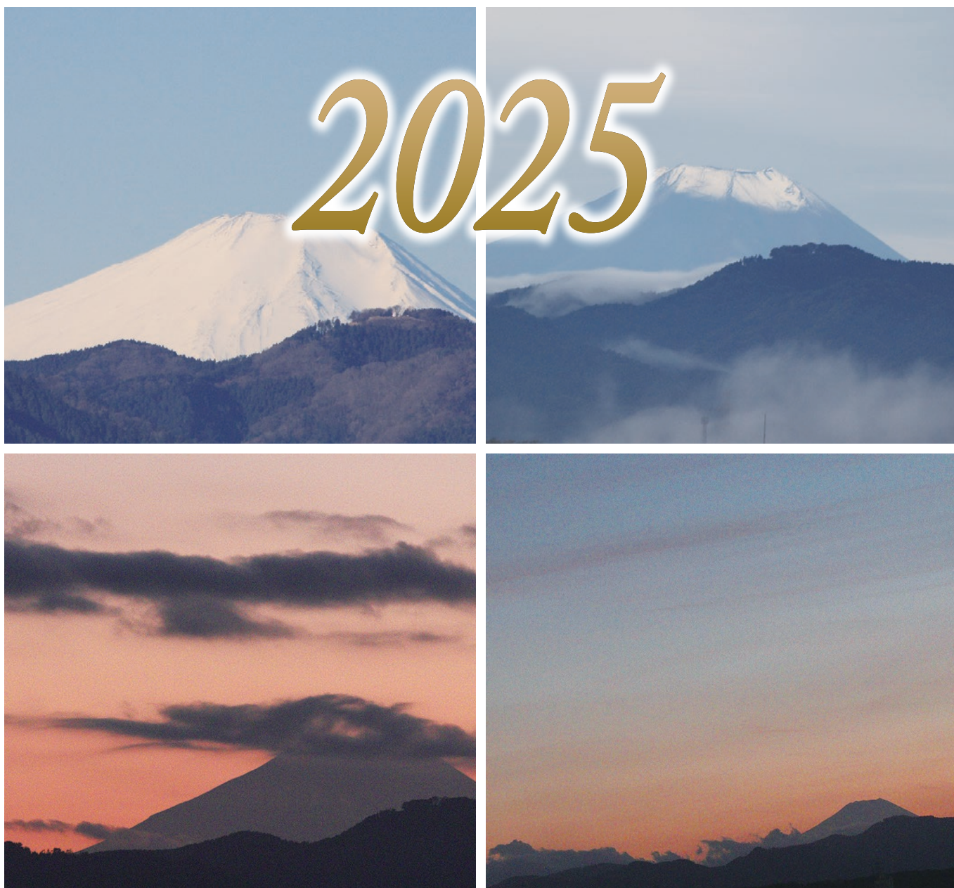
場所：市内拝島駅近郊

〒196-0015 東京都昭島市昭和町一丁目6番11号 電話 042-544-7060 FAX 042-543-9272 ホームページ 昭島市シルバー人材センター