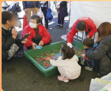
産業まつりでのスーパーボールすくい