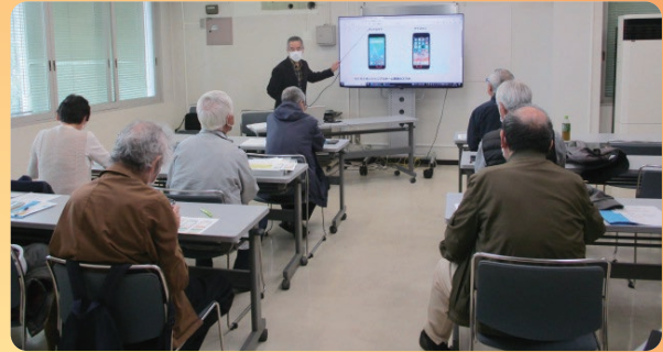
「Smile to Smile」講習会