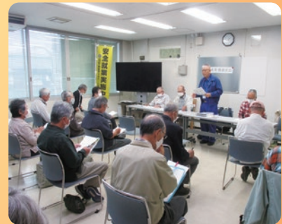
安全就業推進大会