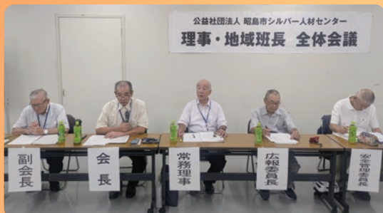
理事・地域班長全体会議