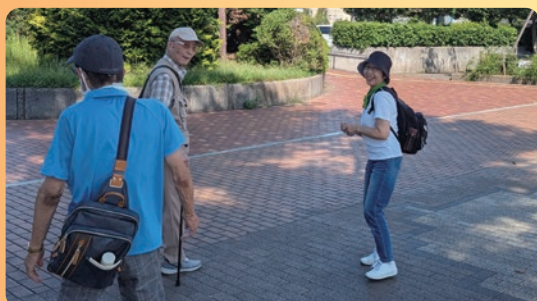
ウォーキング (イキイキ・ニコニコ介護予防教室)