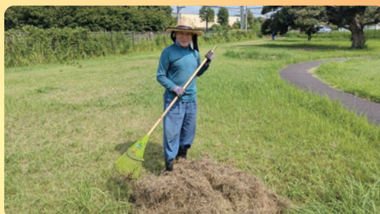
エコ・パーク草とり作業