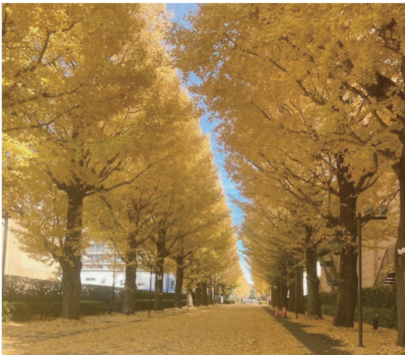
場所:昭島代官山(2024年12月撮影)