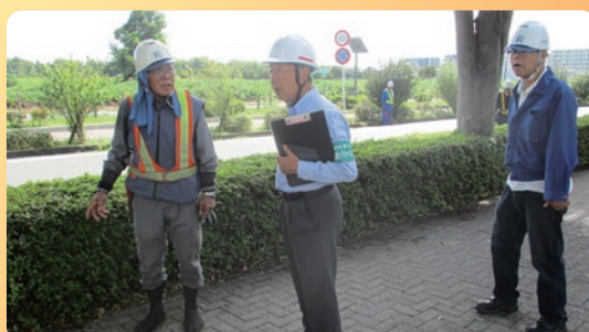
安全就業パトロール巡回指導